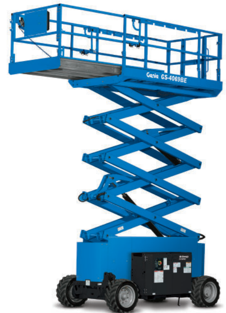
03/17 Ersatzteil Nr. B127304DE