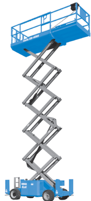
Abb. nur zu Illustrationszwecken. CE Maschinen sind mit Scherenschutz-Paket ausgestattet.